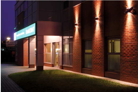
KANLUX S.A. (kat 22441) ZEW EL-235U-B / Krzywa rozsyłu światła (biegunowo)

Oprawa: KANLUX S.A. (kat 22441) ZEW EL-235U-B Lampy: 2 x PRO GU10 LED 7W-NW